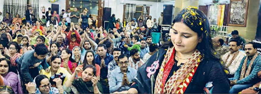
करनाल। श्री खाटू श्याम मंदिर में फूलों की होली खेलते श्रद्धालु।