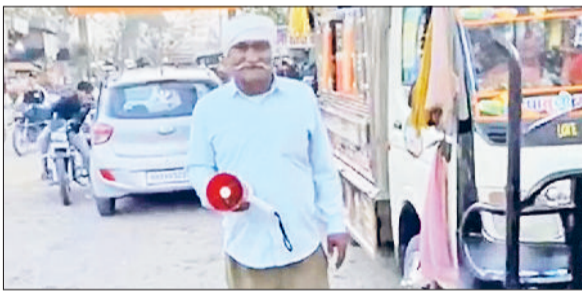
बराड़ा। पीलिया व हेपेटाइटिस-ए के बढ़ते मामलों के बीच मुनादी करते हुए कर्मचारी।

उगाला में पीलिया और हेपेटाइटिस-ए के बढ़ते मामलों ने प्रशासन की चिंता बढ़ा दी है। हालात को गंभीर देखते हुए खंड विकास अधिकारी के निदेश पर पूरे गांव में मुनादी कर सख्त आदेश जारी किए गए हैं। प्रशासन ने साफ कहा है कि खुले में रखे, कटे-फटे या असुरक्षित खाद्य पदार्थों की बिक्री किसी भी सुरत में बंदरिस्त नहीं की जाएगी। गांव में मुनादी के माध्यम से रेडी-फेडी संचालकों को चेतावनी दी गई है कि जंक फूड, दूषित पेय