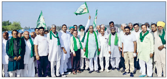
करनाल। रिंग रोड पर सर्विस लेन की मांग को लेकर धरना देते किसान।