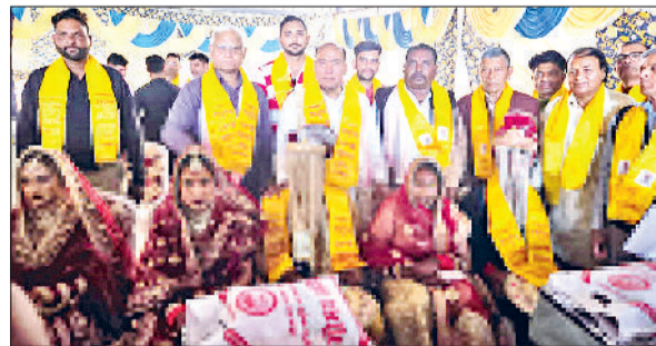
नारायणगढ़। नवविवाहित जोड़ों को आशीर्वाद देते महासभा के पदाधिकारी।