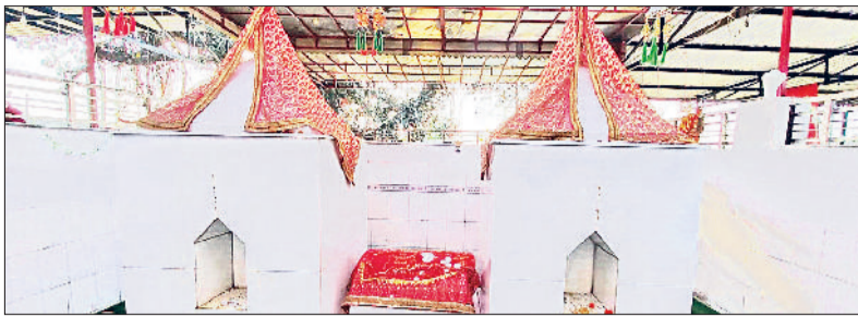
मुलाना। मां शीतला दरबार जागधौली।

गांव जागधौली में 10 मार्च को सैंकड़ों वर्ष प्राचीन एक दिवसीय शीतला माता के मेले का आयोजन किया जाएगा। यह मेला हर साल होली के त्यौहार के बाद आने वाले पहले मंगलवार को लगता है। मान्यता है कि यहां पर श्रद्धालु मन्त मांगते हैं कि उनके बच्चे रोगों से दूर रहे व सही सलामत रहे और मन्त पूरी होने पर परंपरा के अनुसार श्रद्धालु मिट्टी से बने एक बर्तन कंडेरा को चढ़ाते हैं। यहां पर दूर दूराज क्षेत्रों से व पंजाब, हिमाचल, यूपी व अन्य प्रदेशों से भी लाखों की संख्या में श्रद्धालु मत्था टेकने आते हैं। मेले में बच्चों का पहला मुंडन भी कराया जाता है, यानी बच्चों के सुच्चे बाल भी