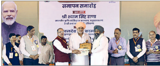
लाडवा। प्रगतिशील किसान को सम्मानित करते कृषि मंत्री श्याम सिंह राणा।

कृषि एवं किसान कल्याण विभाग मंत्री श्याम सिंह राणा ने कहा कि जिस प्रकार आबादी के बढ़ने पर फ्लैट निर्माण हो रहे हैं वैसे ही खेती में भी तकनीक का प्रयोग करने की जरूरत है। धरती पर जमीन का दायरा तय है। जैसे-जैसे परिवार बढ़ रहा है वैसे ही भूमि घट रही है। किसानों को समझना होगा कि वो अपनी जमीन को कैसे बचाए। प्राकृतिक तरीके से खेती और कम पानी वाली फसलों को अपनाने की जरूरत है। कृषि एवं किसान कल्याण विभाग मंत्री श्याम सिंह राणा रविवार को लाडवा की अनाज मंडी में चौधरी चरण सिंह हरियाणा कृषि विश्वविद्यालय हिसार की ओर से आयोजित दो दिवसीय प्रदेश स्तरीय कृषि विकास मेले के समापन पर बतौर मुख्यातिथि बोल रहे थे। मंत्री श्याम सिंह राणा ने मेला परिसर और प्रदर्शनी